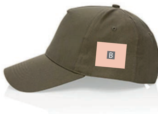
sul lato sinistro